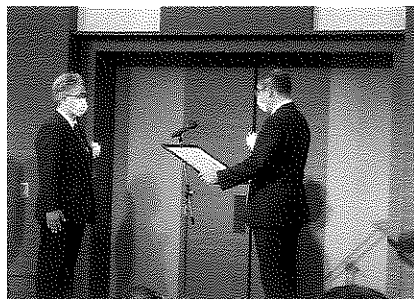
山形県知事表彰 (株)中村建設